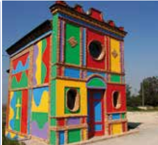
▼ Cappella del Barolo, La Morra