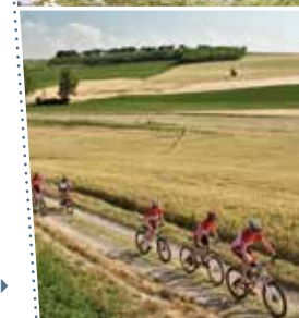
Bike tour nel Monferrato ▶