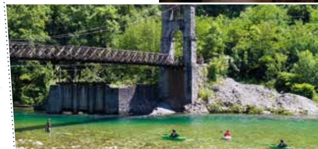
Broletto, Novara ▶