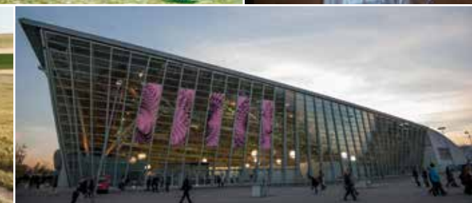
▲ Oval Lingotto, Torino