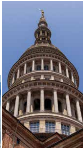
Cupola di S. Gaudenzio, ▶ Novara