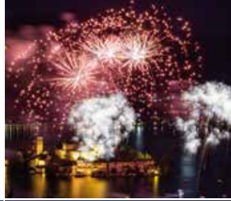
▶ Festival Fuochi di Artificio, Orta San Giulio