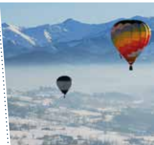
▼ Mongolfiere a Mondovì