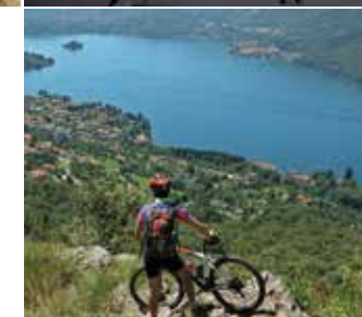
◀ Lago d'Orta dal monte Crabbia