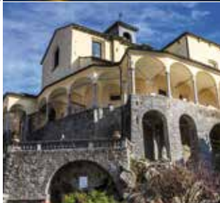
▶ Collegiata di S. Gaudenzio, Varallo Sesia