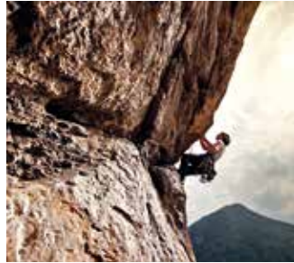
◀ Arrampicata sulle Alpi del cuneese